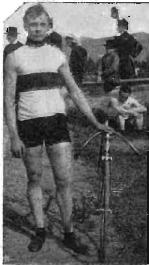
Grogna non è ancor in forma.

L'ultimo forfait sarà dichiarato il 5 giugno p. v. I premi saranno sorteggiati tra i vincitori. Il concorso si chiude alle ore 12 del 7 giugno.