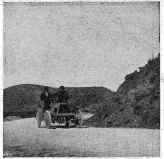
Una vetturella Florentia di 8 HP (turisti).