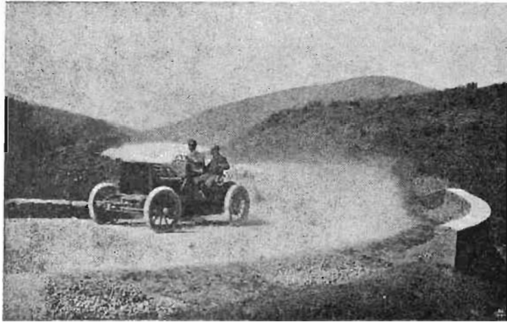
Teste, sulla Panhard di 100 HP.

rinese uno ancora ne aggiunge agli altri molti che conta. E colla Fiat molto onore si è pure fatto la Florentia , una giovane fabbrica che, dopo un lusinghiero battesimo, batte ora sicura la strada maestra.