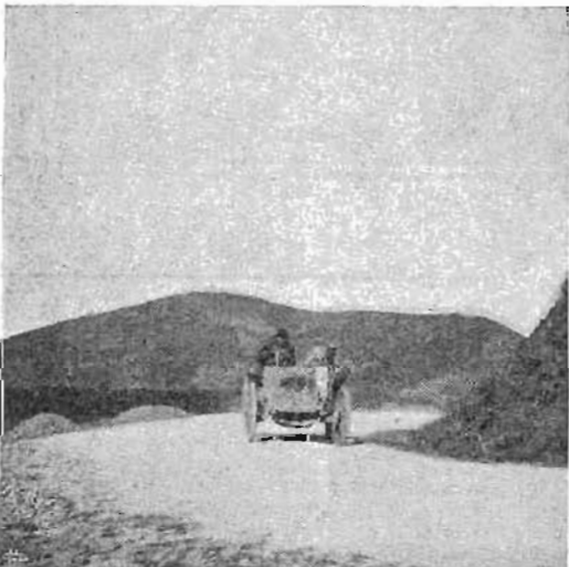
Sidrac vince il 1° premio delle vetture leggere, con Florentia 16 HP. (Fot. Tolomei).

2.a Cat. (vetture leggere). — 1. Hemery ( Darracq 60 hp) in 16' 8" — 2. Spinelli ( Florentia 16 hp) 20' 14" 4/5.