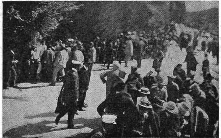
Al traguardo di Castellaccio dopo un arrivo.