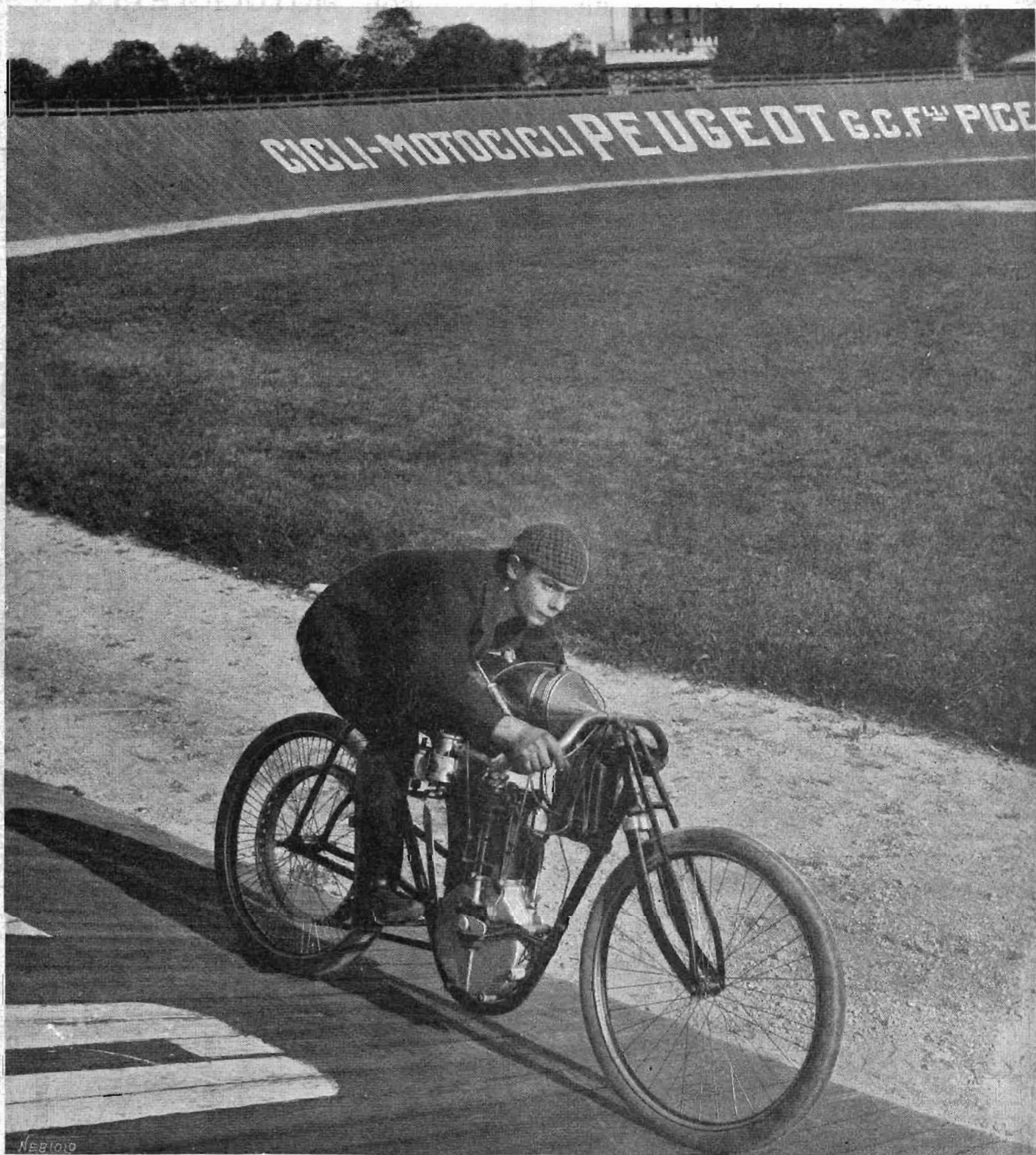
Giosuè Gluppone, campione ciclista italiano di resistenza e vincitore sulla pista del Moto-Velodromo di Torino del campionato italiano motociclistico di velocità e resistenza, conduce ancora una volta alla vittoria la sua ottima Peugeot risultando primo nella riunione di Padova.