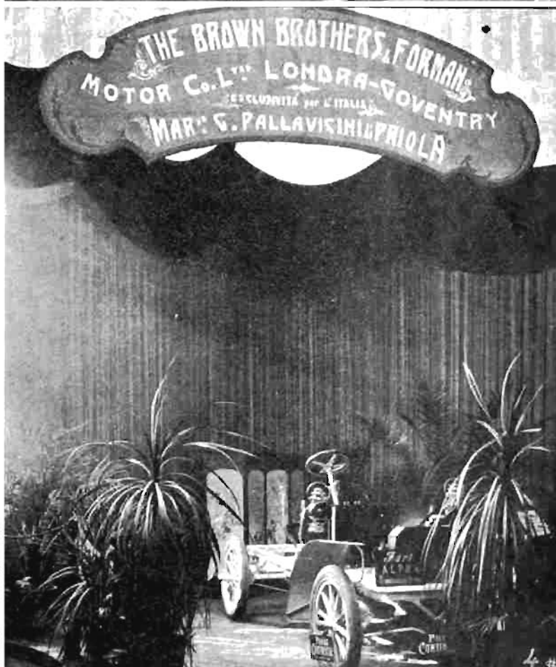
La rassegna della II Esposizione Internazionale d'Automobili. — Alcuni tra gli stands più ammirati del Salone Torinese: 1. S. T. A. R., Società Torinese d'Automobili di Torino. — 2. Florentia di Firenze. — 3. Pirelli e C. di Milano. — 4. Marchese Pallavicini di Priola (importatore della vettura inglese Forman).