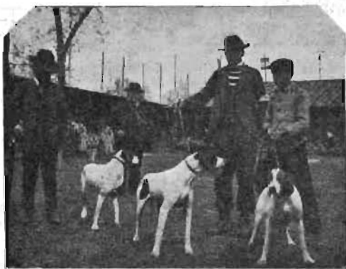
Pointers premiati.

« Notati pure i setters del dott. Meloni.