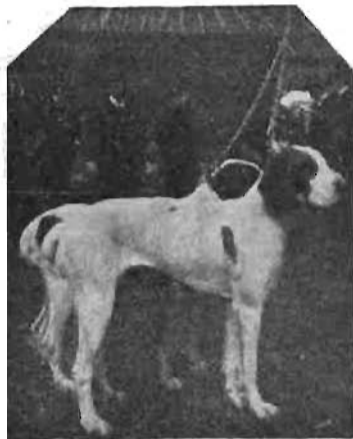
Innanzi al giudice sig. Delor. (Fot. V. Turletti).

« Tre soli erano gli « irlandesi ». « Numerosi gordons e pochissimi i cani di lusso ». Della riuscita di questa esposizione va data lode