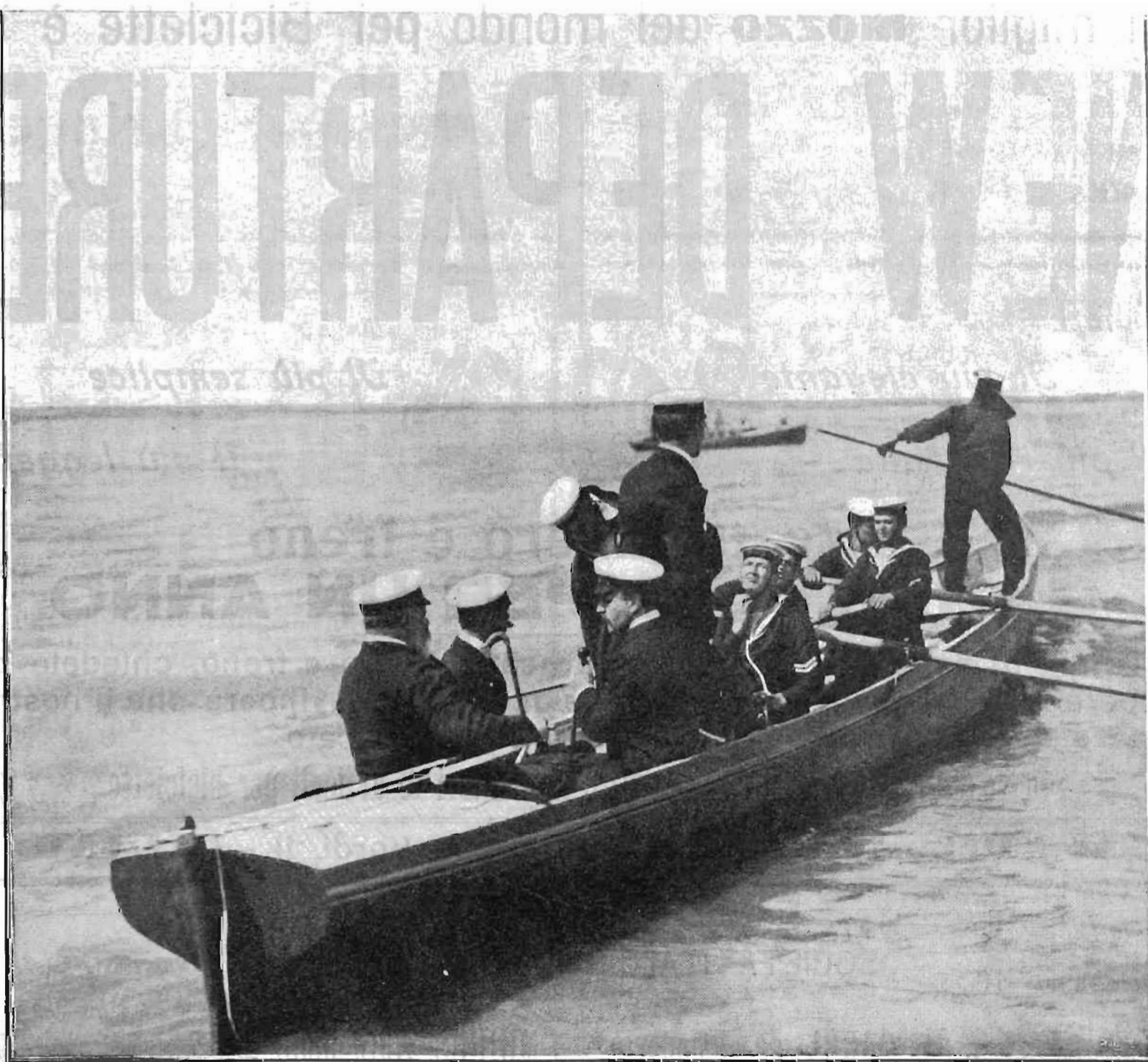
S. M. EDOARDO VII TIMONIERE.

Così le Manifatture Martiny continuano brillantemente il loro cammino, malgrado la lacrimata scomparsa del loro capo, e i giovani ed esperti elementi che oggi ne dirigono le sorti, sono garanzia di fortuna e di prosperità sempre crescente.