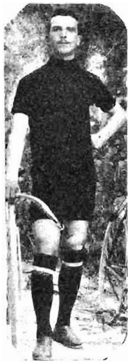
Massa vincitore della corsa del Commercio a Padova.

La valente banda musicale di Perugia, unitamente a quella di Foligno, han rallegrato la bella festa sportiva con della scelta musica perfettamente eseguita.