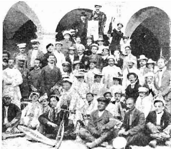
L'inaugurazione del Vessillo del Club Ciclistico di Foligno. (Fot. Ulisse Arcangeli, Foligno).

Solo albergo con completo Garage capace di 8 vetture, munito di fossa e attrezzi, gratuito per i clienti. — Deposito olio benzina. — Occorrendo meccanico. — Massimo confort - Prezzi moderati. F.lli AMBIANO , prop.