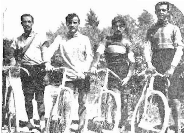
Gli arrivati nel Campionato Ciclistico Meridionale.