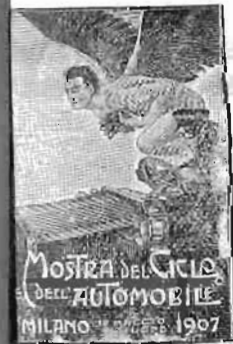
Mostra del Ciclo dell'Automobile MILANO 1907

Le adesioni per l'Esposizione del Ciclo e dell'Automobile di Milano di questa primavera giungono numerosissime al Comitato, e così pure le sottoscrizioni diazioni dalla Società.