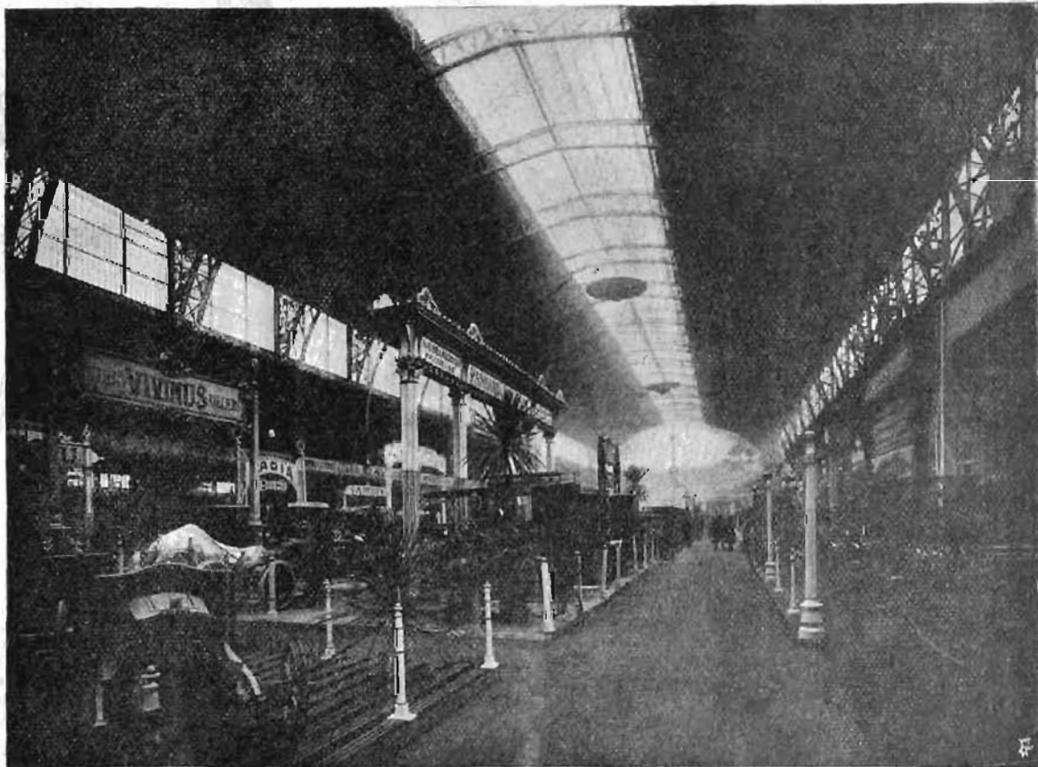
Veduta generale dell'interno dell'Esposizione di Bruxelles.

Il giorno 12 gennaio a Bruxelles si venne, nel