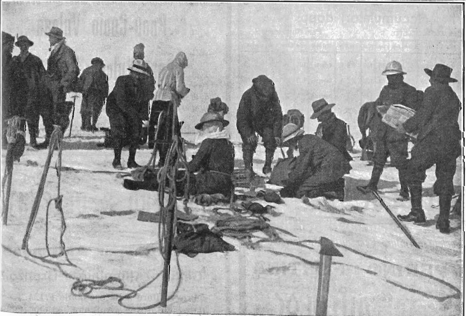
UN'ASCENSIONE AL MONTE BIANCO. - In alto: Durante la marcia. In basso: Una sosta sulla vetta.