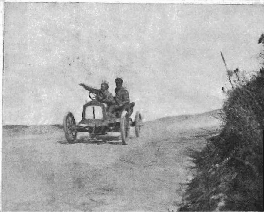
Il cav. Paolo Tasca giunge primo al traguardo finale.