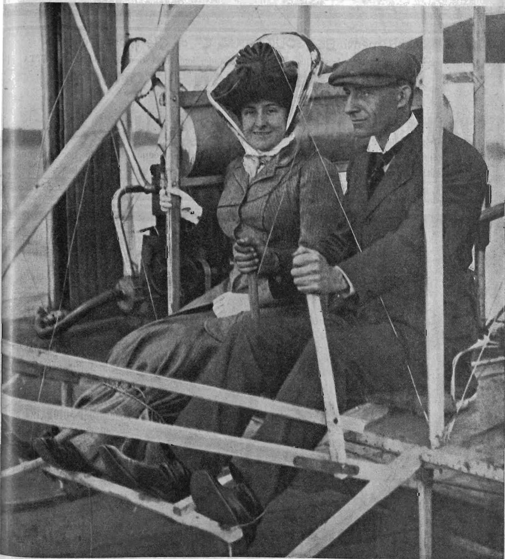
I voli con due persone dell'aeroplano di Wilbur Wright.