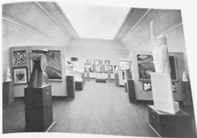
Sala futurista - 17 a Biennale Veneziana 1930. In primo piano si vede a sinistra il "Timoniere" e a destra la "Prua d'Italia" oltre la quale sono allineati "Violinista", "Sentinella" e "Bautta".

delirante passione di gioia, lamenti, cavate dolenti, trilli, spasimi, singhiozzi di un "VIOLINISTA" ideale.