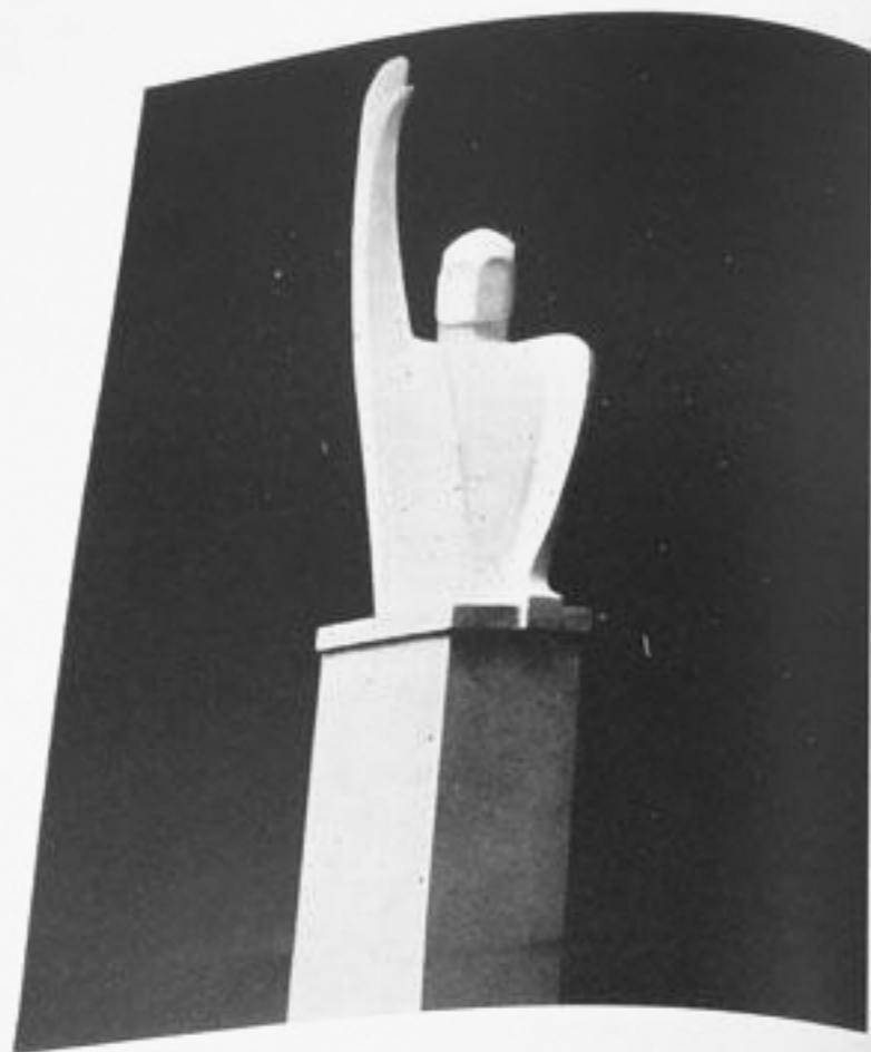
"La Prua d'Italia" - Sintesi plastica del Duce che saluta il popolo dal balcone angolare di Palazzo Chigi. 17 a Biennale Venezia 1930; 4 a Regionale Toscana 1931; Prima Fiera Artigianato 1931. Il primo esemplare appartiene alla Scuola Leonardo da Vinci di Firenze.