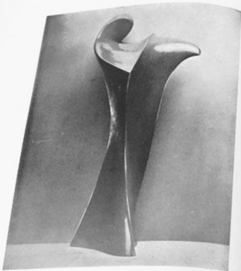
"Violinista" - Sintesi plastica in alluminio laccato in azzurro. Galleria Pesaro 1929, - 17 a Biennale di Venezia 1931. Esistono esemplari nelle collezioni Rothermere a Parigi Goodman a New York, Dr. Polo a Milano.