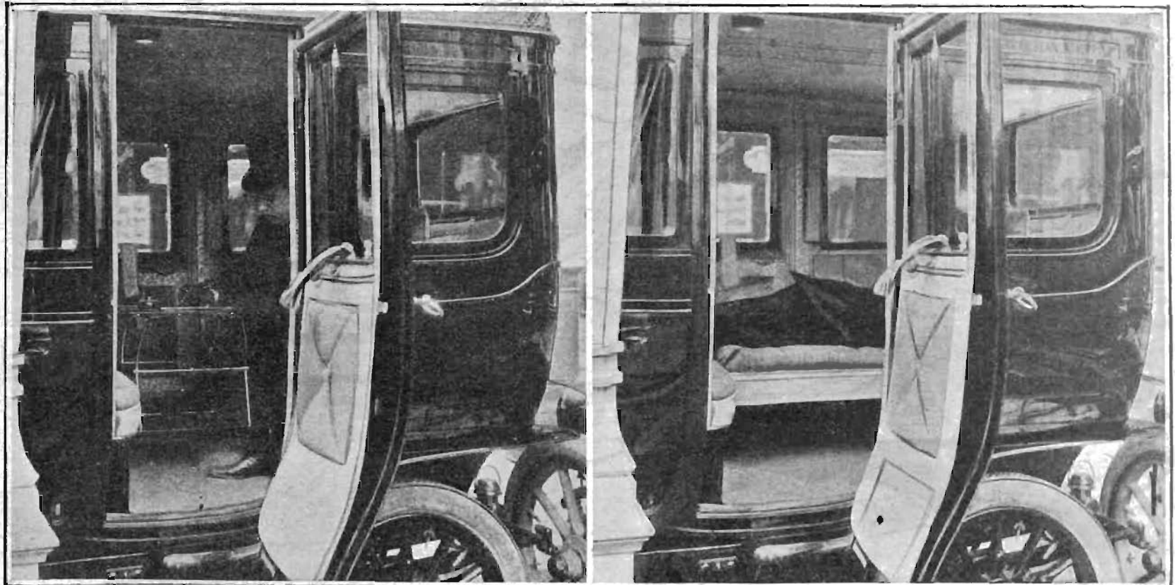
Automobilismo pratico: Le innovazioni e le ingegnose comodità della carrozzeria sono le novità più notevoli dell'automobilismo rivelate dal Salon di Parigi, nel dicembre scorso, e che avranno conferma nella prossima Esposizione Internazionale d'Automobili di Torino.